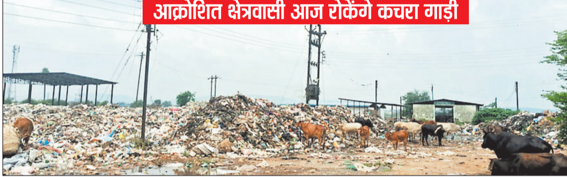
आक्रोशित क्षेत्रवासी आज रोकेंगे कचरा गाड़ी